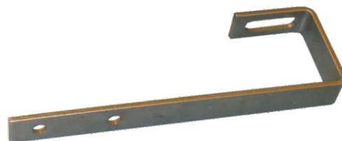
Schrägdach Montage-Set – flache Abdeckung